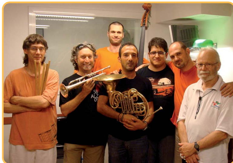
La Jazz Tritó Band oferirà un concert amb un variat repertori de peces interpretades amb estils com ara el swing, el bebop, el cool, el hardbop, el free jazz i el funk.

Totes aquestes activitats es fan a l'Aula Magna del Conservatori