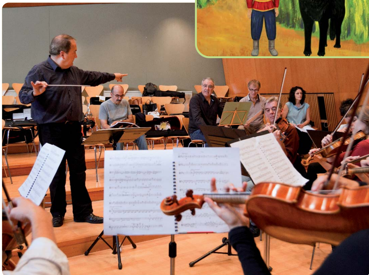
L'Orquestra Simfònica Sant Cugat, assajant “El Pere i en llop” al Conservatori de Música Victòria dels Àngels, el passat dijous.