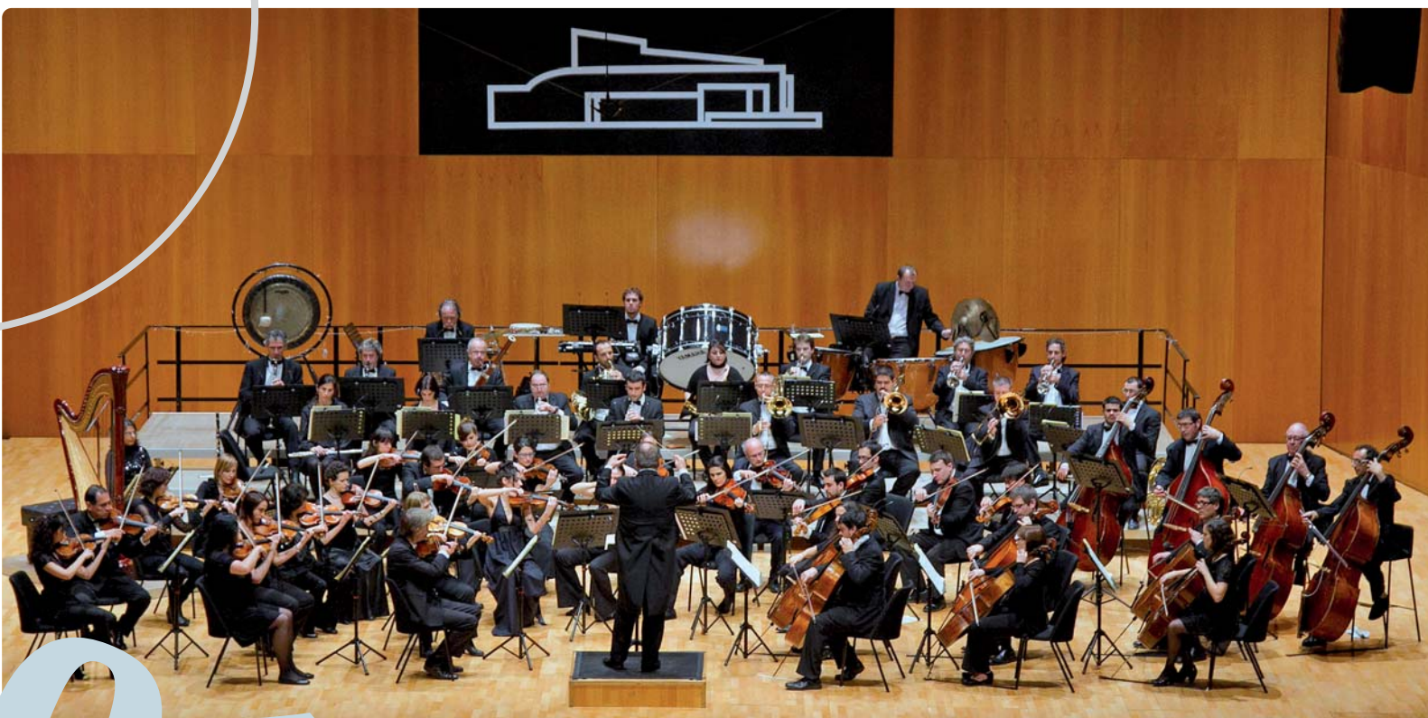
L'Orquestra Simfònica Sant Cugat al Teatre-Auditori de Sant Cugat el passat 27 de desembre oferint el mateix concert que avui.