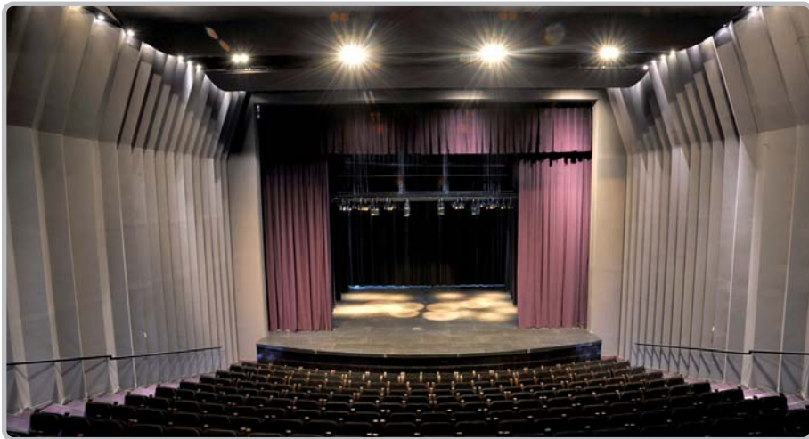
El Teatre Plaza ha acollit el concert de l'Orquestra Simfònica Sant Cugat.